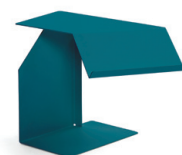
DIANA F 2002