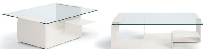
Cremeweiß creme white

Estructura de acero. Microestructura de laca pulverizada. Parte inferior recubierta de polietileno. Tablero de cristal. Para más detalles y colores, ver lista de precios.