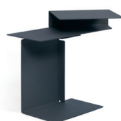
DIANA E 2002