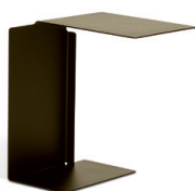
DIANA B 2002