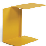
DIANA A 2002